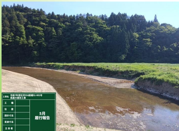
5月末の現場状況です。

地域のみなさま、いつもお世話になっております。 馬籠川護岸工事の現在の状況をお知らせいたします。 現在、仮橋に使用する鋼材の加工を工場で行っています。今後は、工 事用道路や仮橋の設置に向けて準備・施工を行ってまいります。